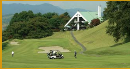
蔵王カントリークラブ tel.023-688-7777 fax.023-688-7778