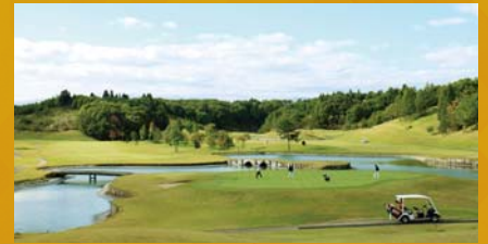
新庄アーデンゴルフ倶楽部 tel.0233-23-5800 fax.0233-23-5835

※注意事項 参加者は自己の責任において参加し、主催者は障害・ 紛失その他の事故については責任を負いません。 また、プレー中携帯電話の使用を禁止します。