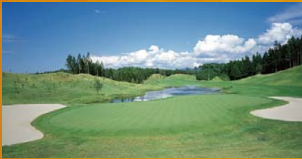
庄内ゴルフ倶楽部 tel.0234-56-3322 fax.0234-56-3323