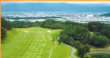
天童カントリークラブ tel.023-656-2241 fax.023-656-2457