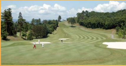
OISHIDA GOLF CLUB tel.0237-58-2233 fax.0237-58-2705