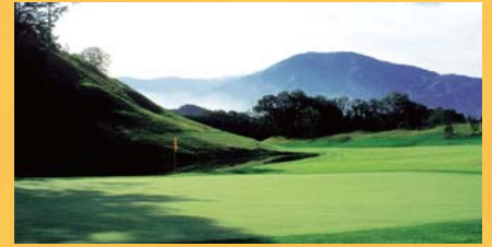
さくらんぼカントリークラブ tel.0237-53-3311 fax.0237-53-3310